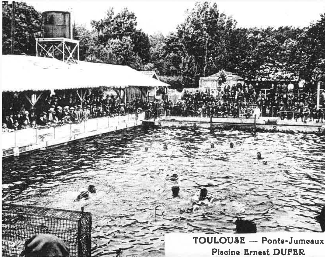
TOULOUSE — Ponts-Jumeaux Piscine Ernest DUFER

plate-forme se situant à 5 mètres de haut, un bassin d'apprentissage complétant l'ensemble. Inutile de le dire : de ce fait la piscine va être de plus en plus fréquentée. Des personnalités viennent y nager elles aussi, ainsi le grand pilote Doret, virtuose de la voltige aérienne.