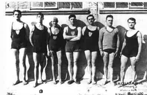
4 et 5 Équipes de Water-Polo